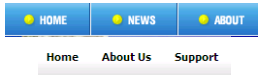
Gambar Textual link