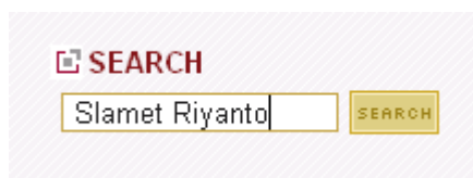
Gambar Fasilitas Pencarian