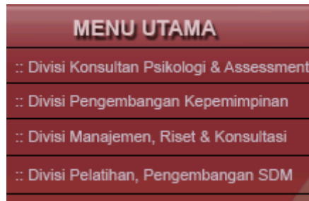
Gambar Papan Navigasi